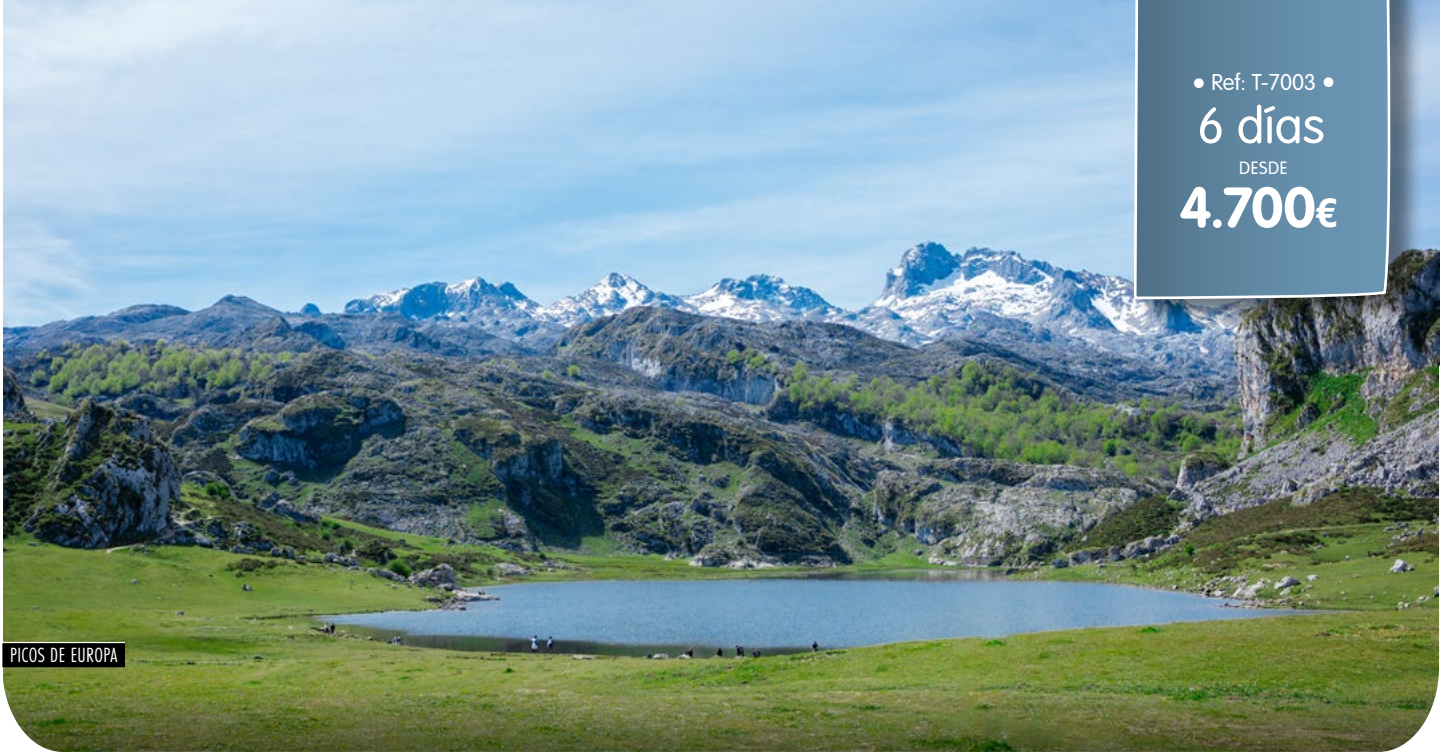
PICOS DE EUROPA