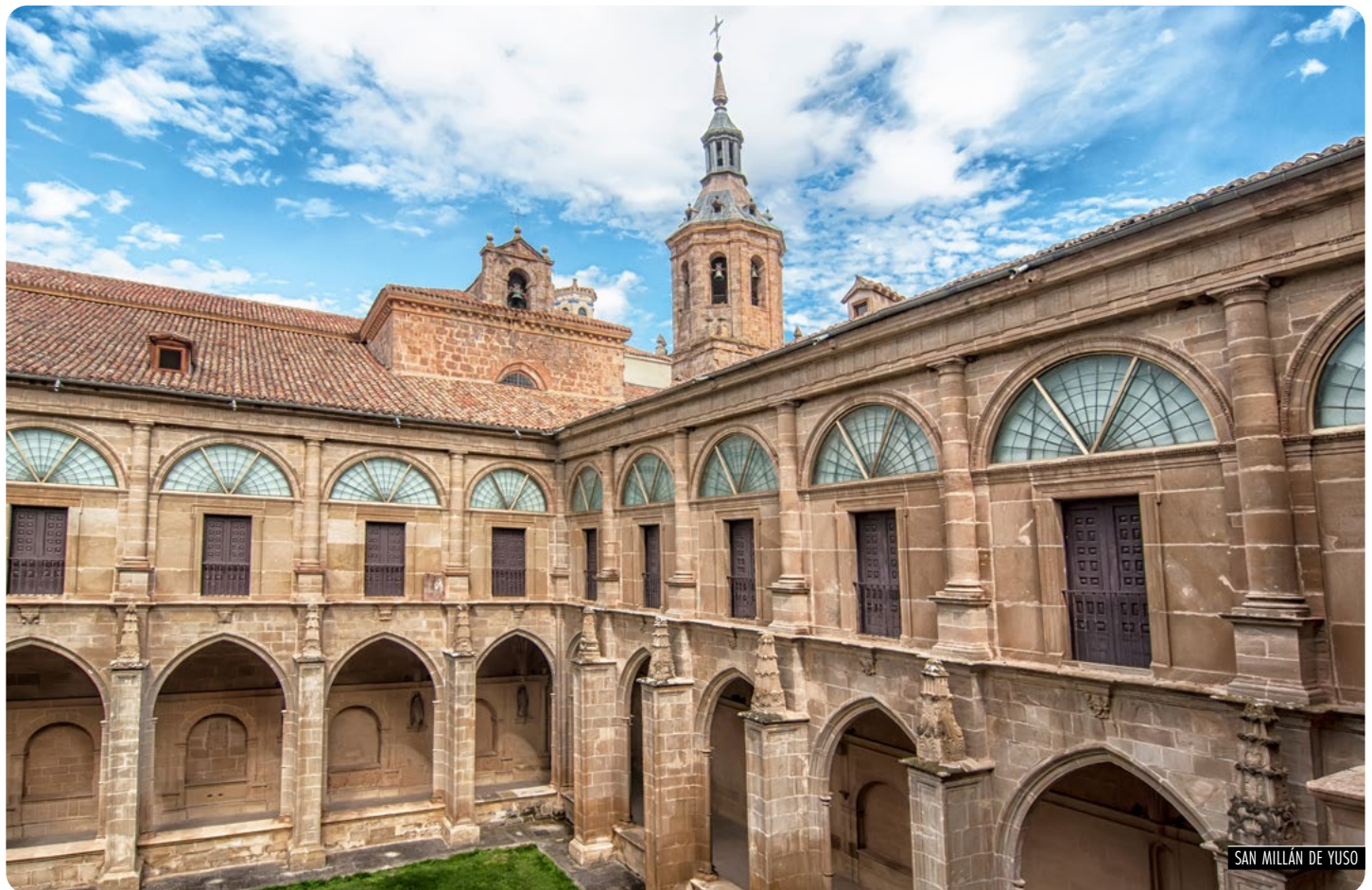
SAN MILLÁN DE YUSO