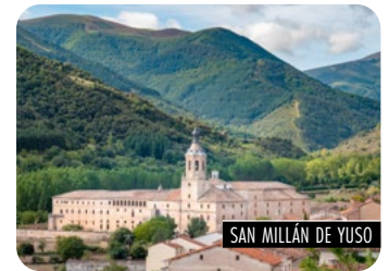
SAN MILLÁN DE YUSO